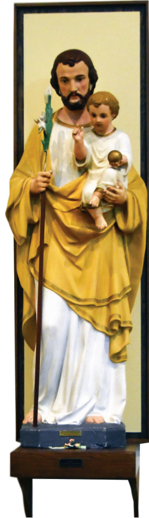
Estatua de San José en la parroquia Católica de Saint Marguerite, Tooele - Utah