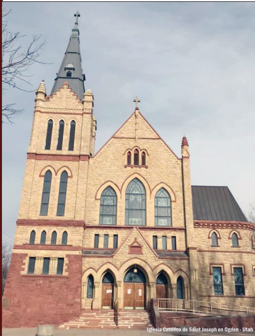
Iglesia Católica de Saint Joseph en Ogden - Utah

Protege, oh providentísimo Custodio de la divina Familia, la escogida descendencia de Jesucristo; aleja de nosotros, oh padre amantísimo, este flagelo de errores y vicios. Asístenos propicio desde el cielo, en