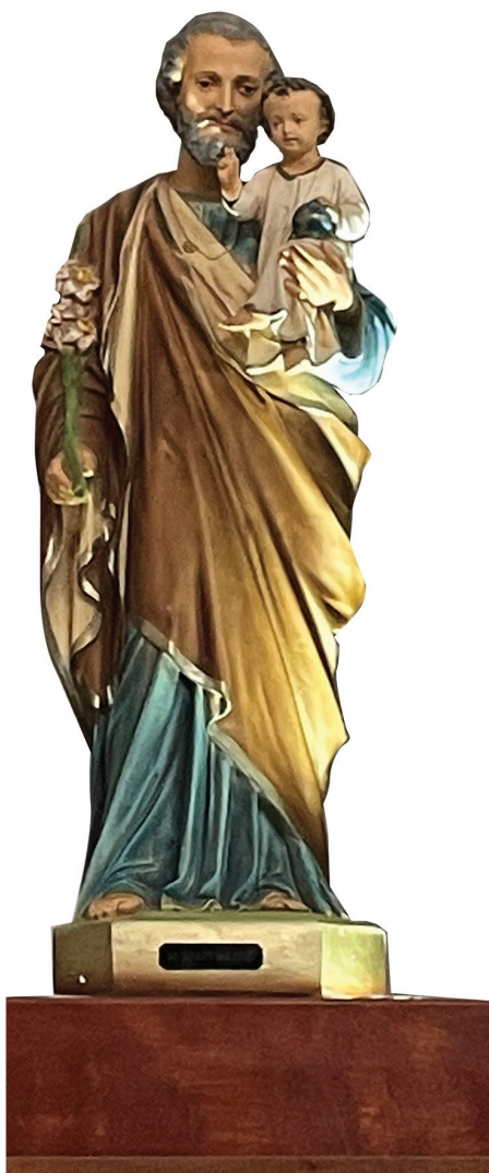
Estatua de San José en la parroquia Católica de Christ the King, Cedar City - Utah