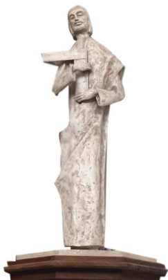
Estatua de San José, Iglesia de Saint Thomas More, Cottonwood Heights - Utah

Descarge de manera gratuita un Pasaporte Peregrino en la página en línea de la Diócesis de Salt Lake City en: www.dioslc.org