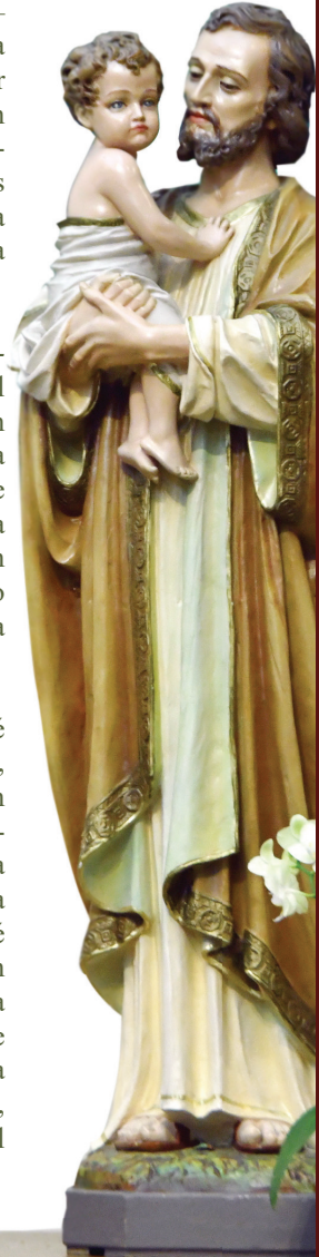
Estatua de San José, parroquia Católica de Saint Olaf, Bountiful - Utah

Nuestro Santo Padre describe a San José como un padre amado, amoroso, tierno, como un padre obediente y de aceptación; un padre quien es creativamente valiente, un padre trabajador, un padre en las sombras. El Papa ha dicho que la pandemia del coronavirus ha intensificado su deseo de reflexión en San José ya que muchas personas durante la misma, han realizado infinidad de sacrificios para proteger a las personas, tal como San José silenciosamente protegió y cuidó de María y de Jesús. El Papa desea que “cada miembro fiel, siga su ejemplo, fortalezca su vida de fe diariamente con la total culminación de la voluntad de Dios.”