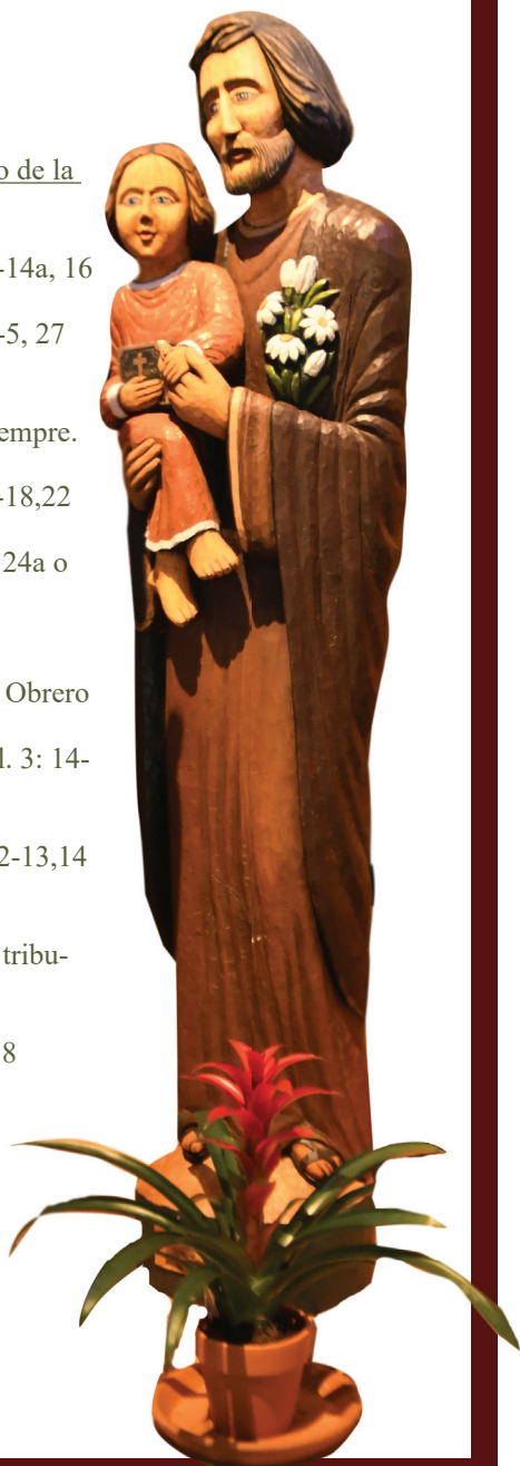
Estatua de San José en la parroquia Católica de Saint Martin de Porres, Taylorsville - Utah