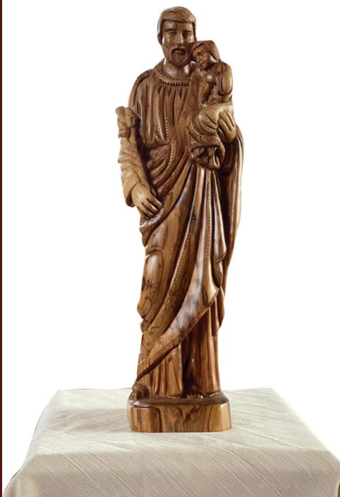
Estatua de San José, Iglesia de Saint Mary of the Assumption, Park City - Utah