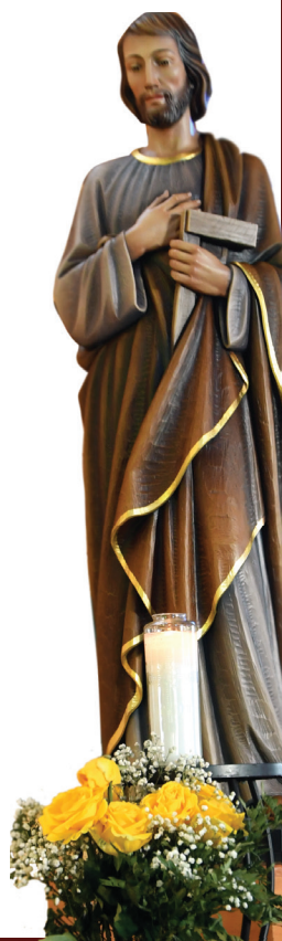
Estatua de San José en la parroquia Católica de Saint Joseph the Worker, West Jordan - Utah