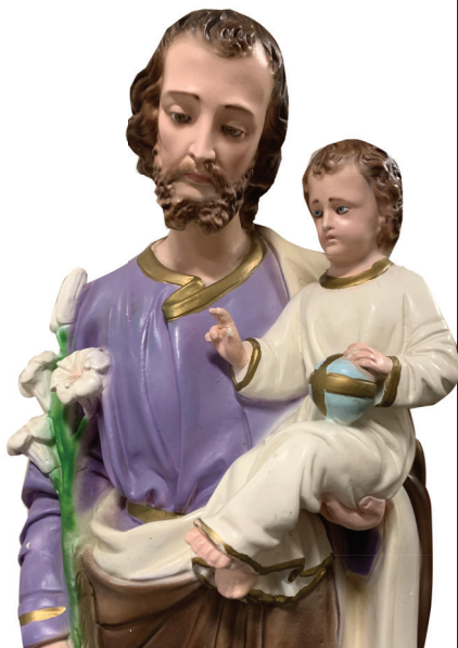
Estatua de San José en la escuela primaria Católica de Saint Joseph, Ogden - Utah