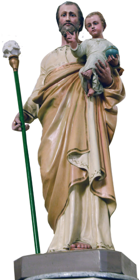
Estatua de San José en la parroquia Católica de Saint Joseph, Ogden - Utah

José acogió a María sin poner condiciones previas. Confió en las palabras del ángel.