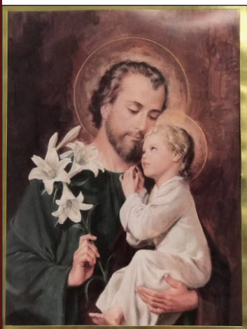
Imágen de San José Iglesia de Saint Lawrence, Heber - Utah