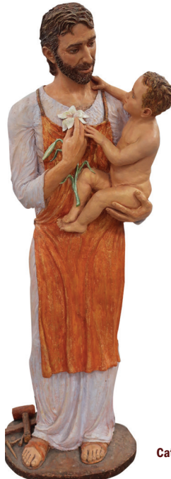
Estatua de San José en la parroquia Católica de Saint Andrew, Ruverton - Utah