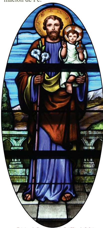
Estatua de San, parroquia Católica de Saint Joseph, Ogden - Utah

En su Carta Apóstolica Patris Corde del 8 de diciembre, el Papa Francisco nos recuerda que San José permanece como un modelo de humildad y servicio. Los siguientes fragmentos del Patris Corde pueden ser usados para la contemplación y oración. Las Preguntas de reflexión están patrocinadas por la Oficina Diocesana de Formación de Fe.