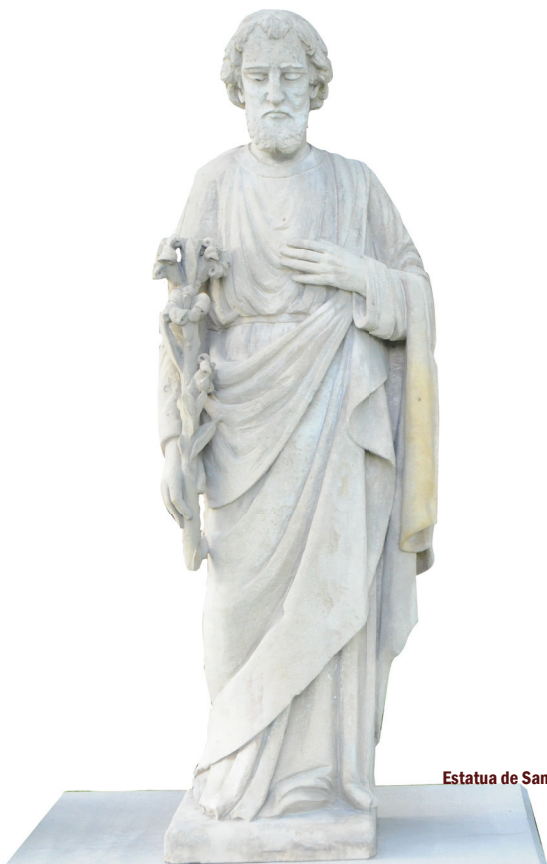
Estatua de San José en Saint Joseph Villa, Salt lake City - Utah

http://www.vatican.va/content/francesco/es/apost_letters/documents/papa-francesco-lettera-ap_20201208_patris-corde.html