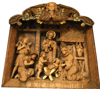
La Sagrada Familia, Catedral de la Magdalena, Salt Lake City - Utah