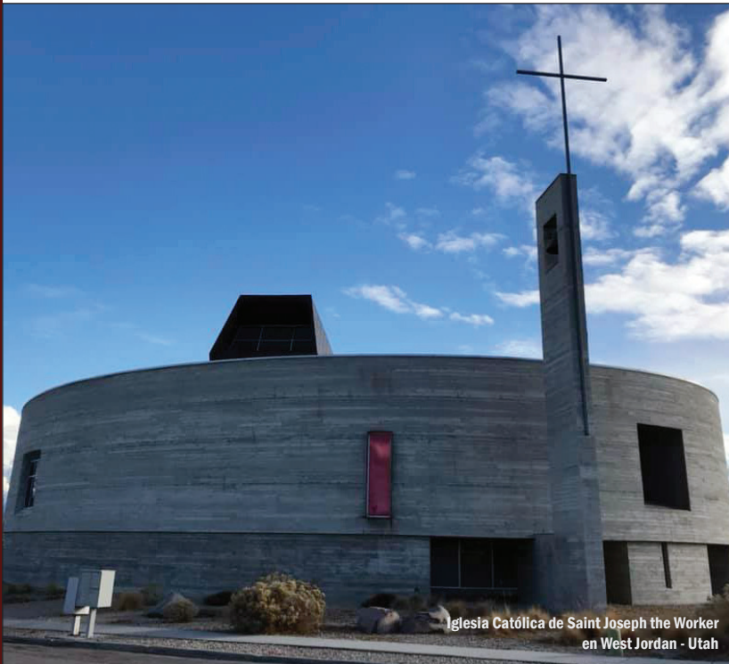
Iglesia Católica de Saint Joseph the Worker en West Jordan - Utah